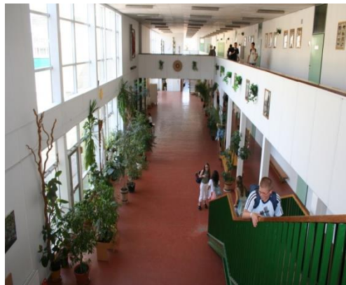
Tágas és világos terek