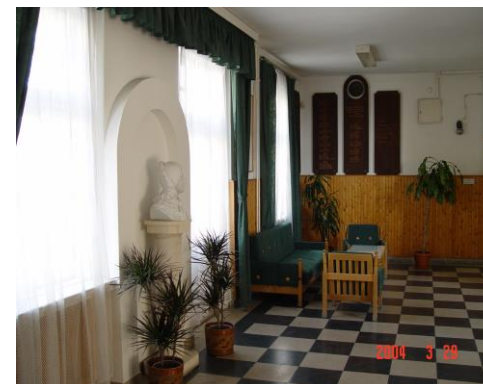
Ősök emlékét őrző folyosók