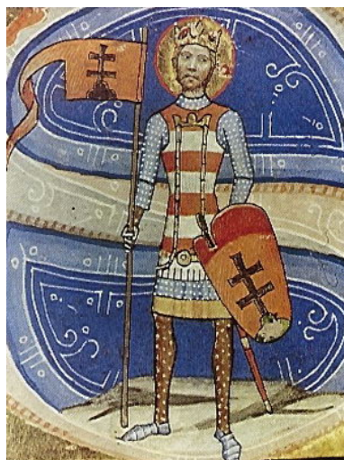
Szent István ábrázolása a Képes Krónikában 1